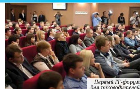
Первый IT-форум для руководителей

Не имеющие аналогов методы осуществления контроля – Запись Звонков и Видеоконтроль несомненно заинтересовали руководителей и владельцев бизнеса, присутствующих на форуме. Всем гостям были вручены сертификаты на бесплатный тест новых услуг.