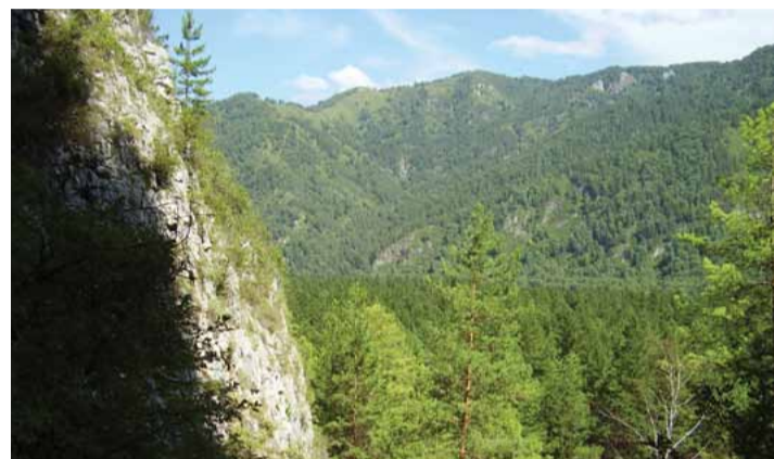
Участок золоторудного месторождения «Федоровский-1» расположен в Междуреченском районе, на границе Кузбасса и Хакасии

Собственник ОАО «Горнорудная компания «Кемерово-Москва» («КеМо»), владеющего лицензией на Федоровское месторождение золота в Междуреченском районе, надеется, что золотодобывающий проект, которому уже двенадцать лет, получит результативное продолжение. Но для этого «КеМо» потребуется выйти из второго за последние пять лет конкурсного производства. Чтобы это сделать, собственнику компании, томскому ООО «Малка УК», необходимо договориться с Банком Москвы, основным кредитором горнорудной компании. Пока же собственника штрафует арбитражный суд за то, что он не предоставил документы банкрота конкурсному управляющему.