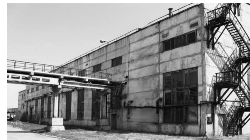
ПО «Химпром» было построено в 1938 году как Кемеровский азотно-туковый завод, на тот момент первое предприятие химической отрасли в Кузбассе. В настоящее время специализируется на производстве хлора, каустика, тосола, тормозной жидкости, злоростого кальция и др. продуктов. В октябре 1998 года на «Химпроме» (тогда ОАО) было введено внешнее управление, через два года – конкурсное производство. Активы банкрота оказались в составе ООО «ПО «Химпром», подконтрольного ООО ФПС «Сибконкорд». Новое предприятие продолжило производственную деятельность.