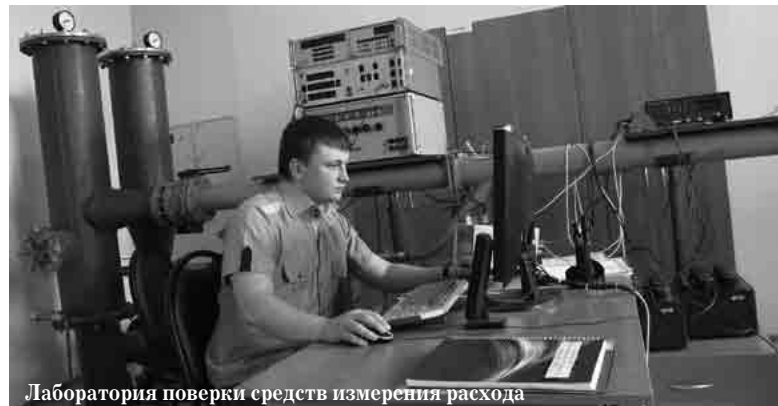
Лаборатория поверки средств измерения расхода

г. Кемерово, ул. Волгоградская 51а; т. +7(3842) 311-311 E-mail: td.kemi@gmail.com www.kuzenergo.ru