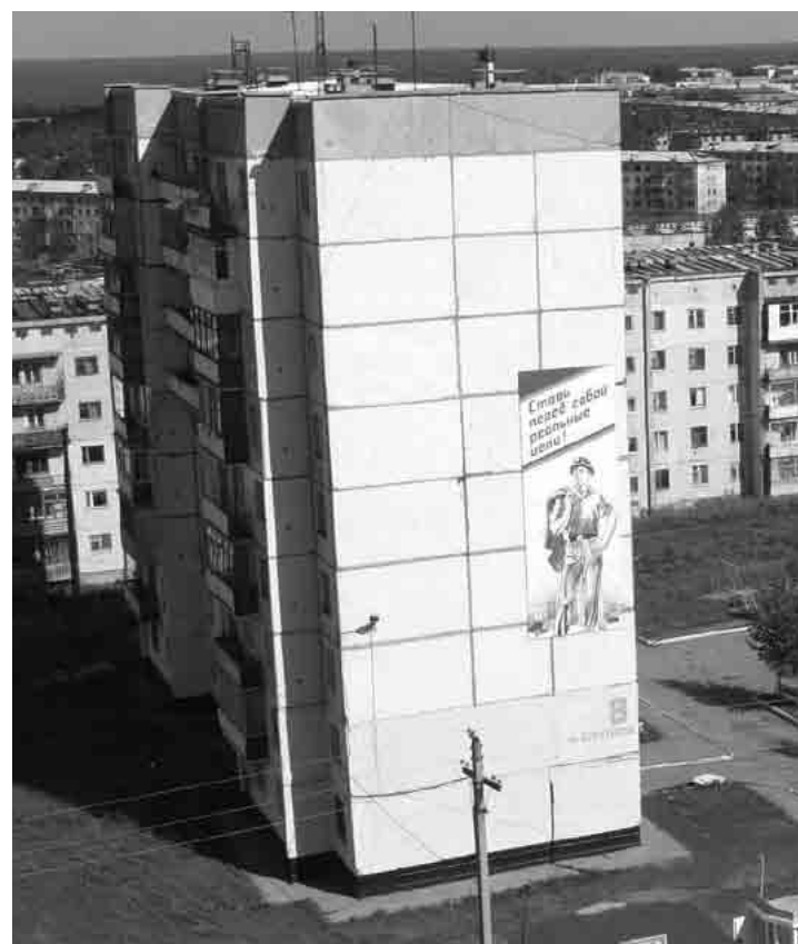
Окончание. Начало на стр. 6