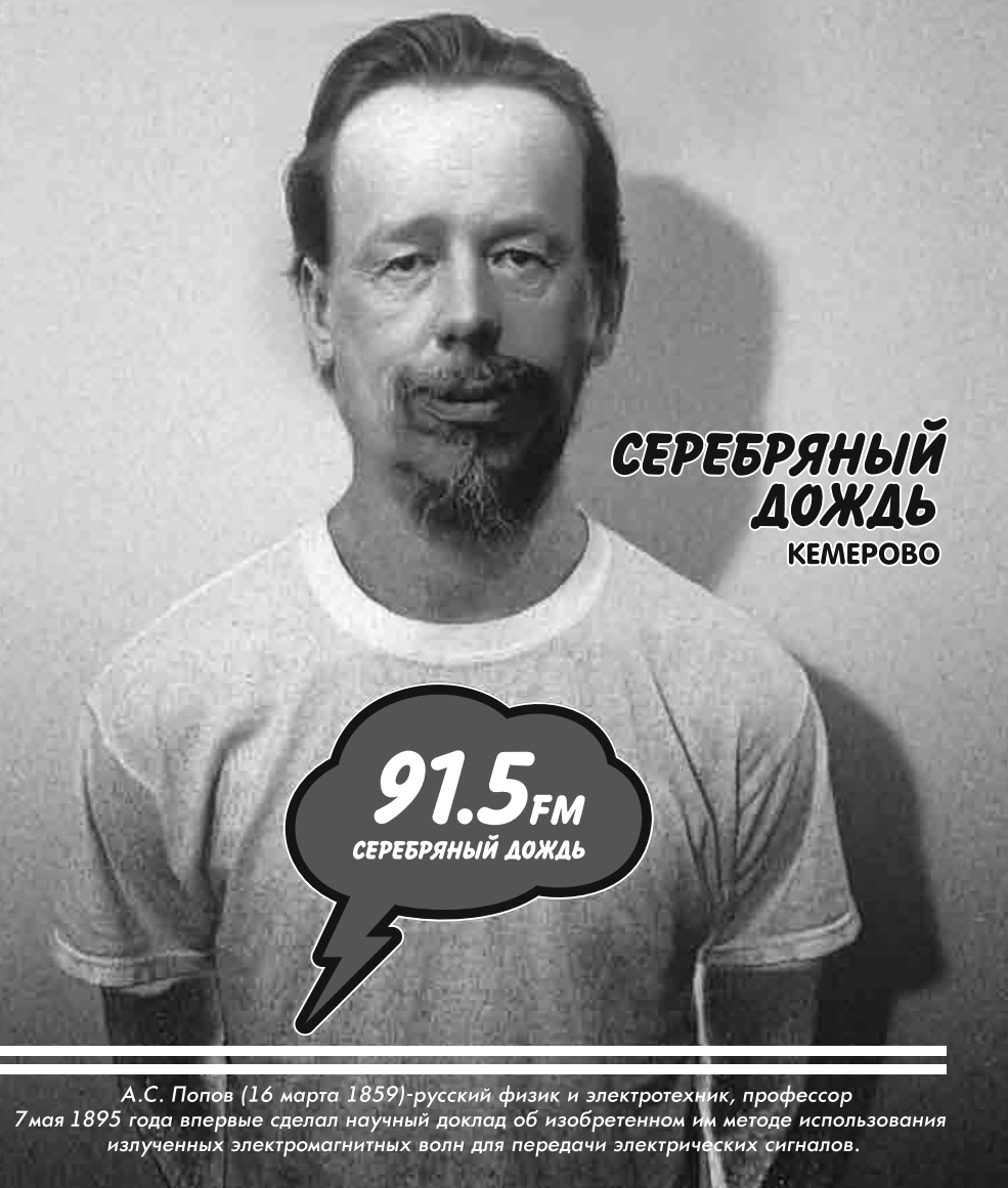
А.С. Попов (16 марта 1859) – русский физик и электротехник, профессор 7 мая 1895 года впервые сделал научный доклад об изобретенном им методе использования излученных электромагнитных волн для передачи электрических сигналов.