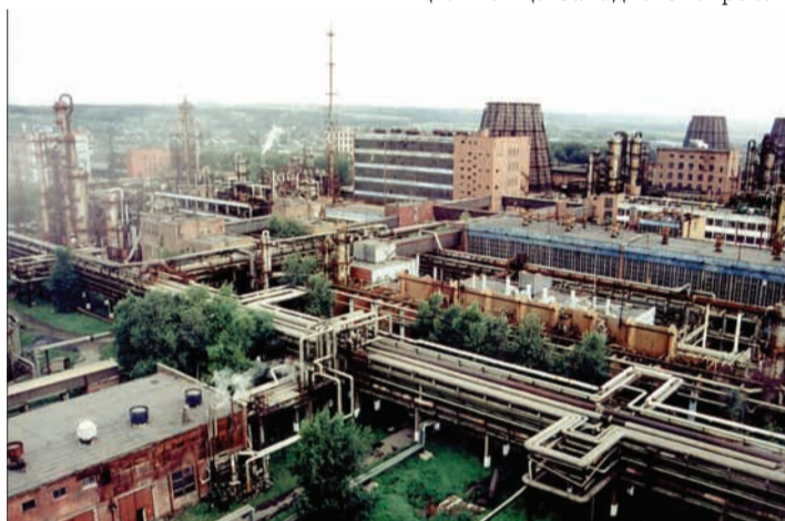
Одно из крупнейших промышленных предприятий региона — кемеровское ОАО «Азот» — в числе подписавших обращение к председателю Высшего арбитражного суда РФ

Земельный вопрос «испортил» условия работы кузбасскому бизнесу после того, как с 1 января 2009 года на территории Кемеровской области были введены новые условия взимания земельного налога. Он базируется на кадастровой оценке земли, которая была утверждена постановлением коллегии обладминистрации в ноябре 2008 года. По новой оценке кадастровая стоимость земельных участков была увеличена в среднем в 5-8 раз, что вызвало соответствующее увеличение налога для собственников земли.