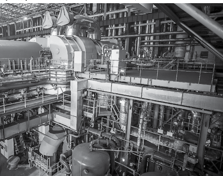
Введенный в декабре 2014 г. блок №6 Беловской ГРЭС стал финальным в реализации программы ДПМ в Кузбассе

Под руководством нового собственника из далекого Волгограда «Центральная ТЭЦ» переводится на природный газ, топливо заметно более дорогое, чем коксовый газ и уголь. При новом собственнике, станция полностью перестаёт оплачивать новое топливо, накапливает 1,6 млрд рублей долгов всего за год, после чего и этот собственник не извлекается, передав её муниципалитету. Теперь это, что называется «голова» в ряд городских властей. Однако они вряд ли смогут поправить экономику станции – она очень старая, оборудование по большей части требует замены, на что вряд ли муниципалитет найдётся деньги. К тому же ТЭЦ теперь работает на природном газе, значит, себестоимость тепла резко выросла, и теперь каждую гигакалорию придется субсидировать из бюджета все больше